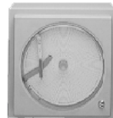
Registrador Circular de Temperatura MTR-C954

SANYO Commercial Solutions A Division of SANYO North America Corporation 1062 Thorndale Avenue, Bensenville, IL 60106 USA Toll Free USA 800-858-8442 • Fax 630-238-0074 www.sanyobiomedical.com